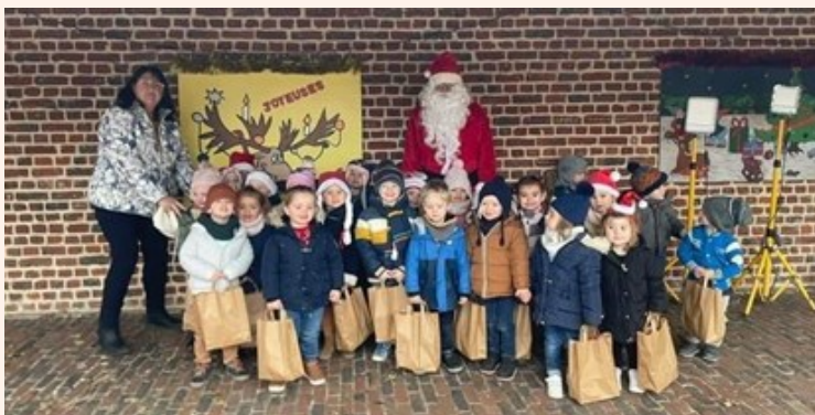
Ecole Michel DE MONTAIGNE