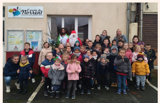
Animation de Noël de la Commune