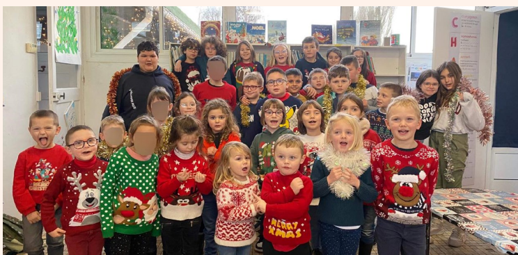
Ecole Notre Dame