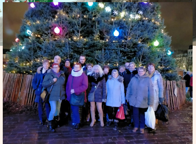
Voyage du Comité des Fêtes à Metz et au Luxembourg

Au cours de la période qui a précédé Noël, plusieurs manifestations ont été proposées : le Marché de Noël du Comité des Fêtes les 2 et 3 Décembre, celui de Bruxelles des Norrent-Fonturiers, ceux de l'école Michel DE MONTAIGNE et de l'école Notre Dame, le séjour à Metz et au Luxembourg du Comité des Fêtes, l'animation communale le 13 Décembre après-midi en partenariat avec le Centre de Loisirs les P'tites Pousses.