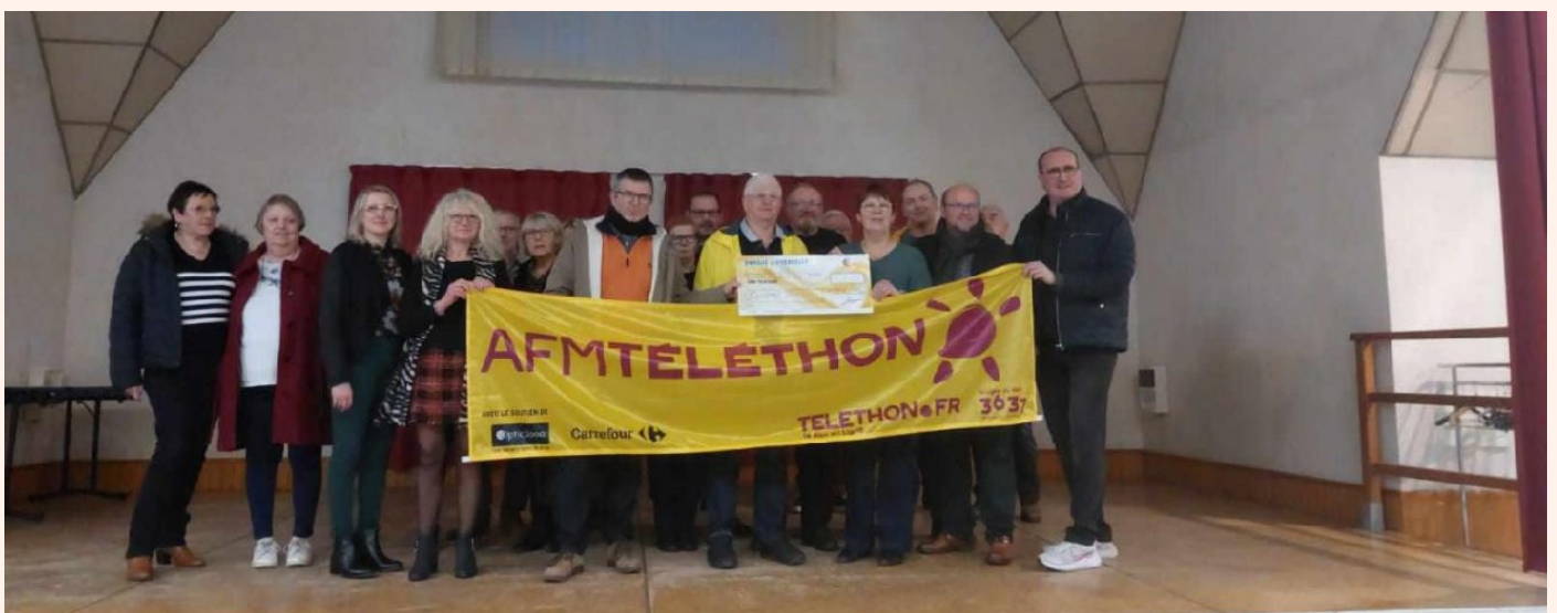
Remise du chèque Téléthon