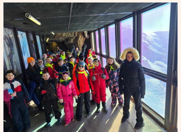
L'équipe des P'tites Pousses