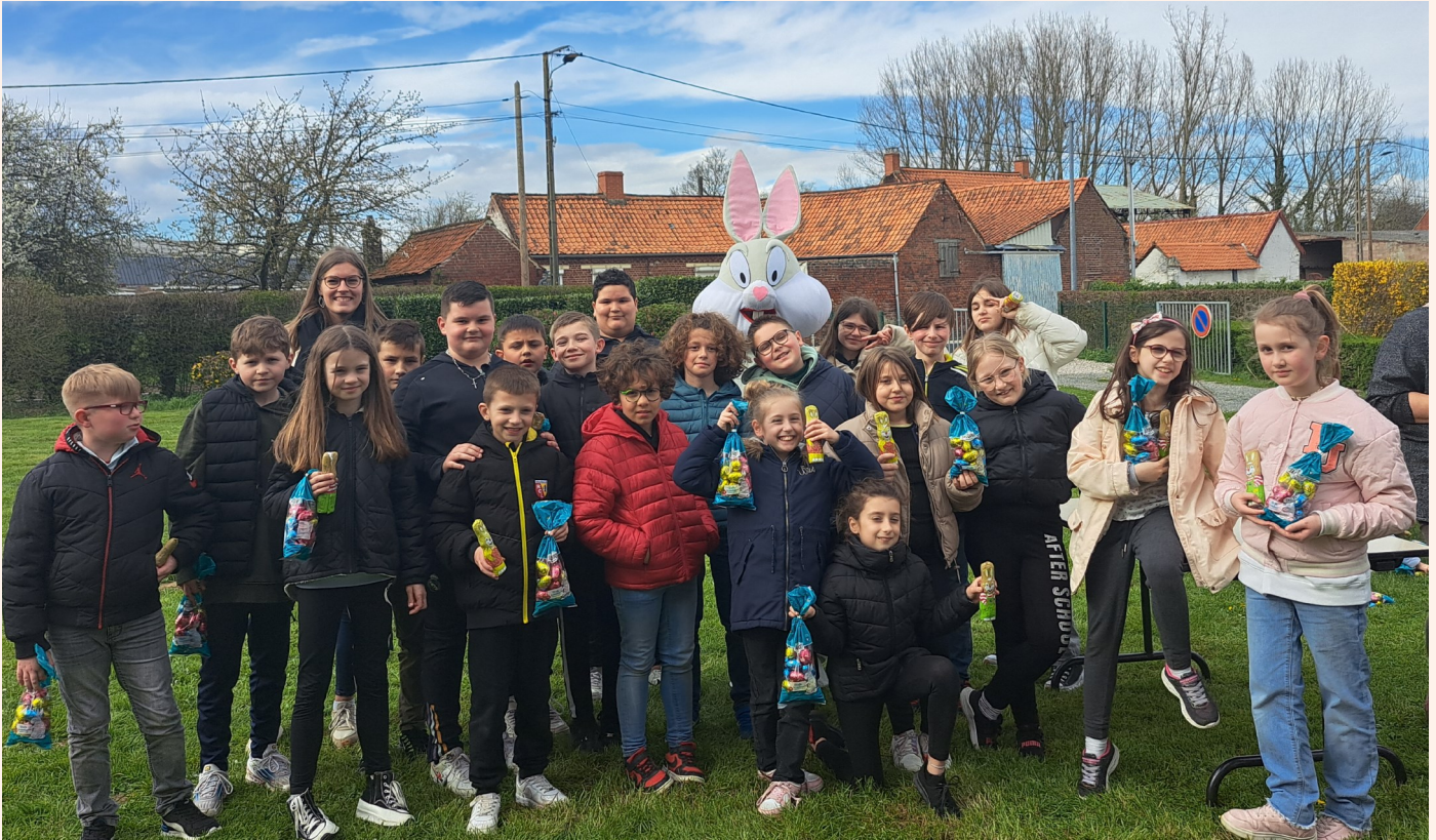
Une chasse à l'œuf était organisée pour les enfants de l'école le Vendredi 29 Mars.