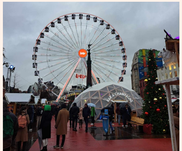
Voyage des Norrent-Fonturiers à Bruxelles