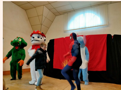
Défilé de mascottes